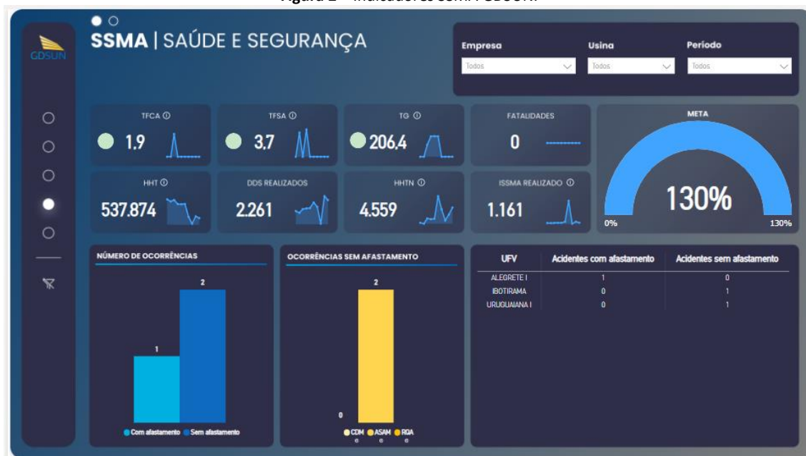
Figura 2 – Indicadores SSMA GDSUN.

frequência de acidentes sem afastamento – TFSA; Taxa de gravidade – TG; Número de horas homens treinamento realizado (HHTN); Número de ocorrência com e sem afastamento; Número de DDS e inspeções realizadas; e, Panorama de localização das ocorrências por usina.